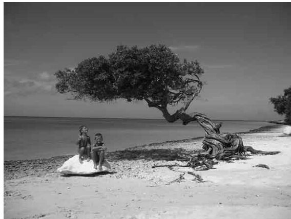
De meest gefotografeerde boom van Aruba